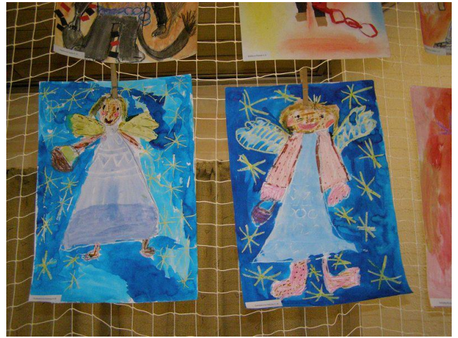
Výstava prací v kině