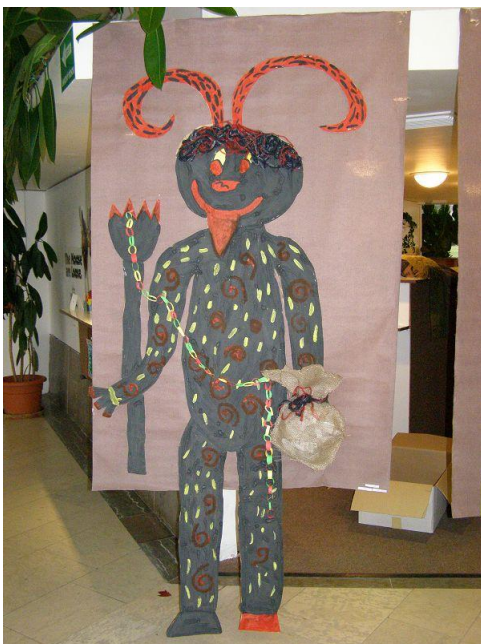
Výstava prací v kině