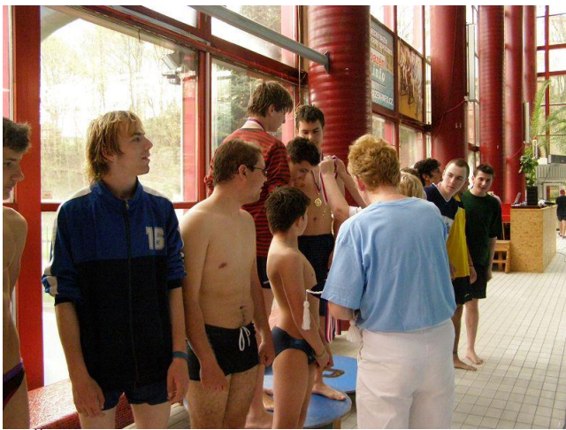
MČR v plavání – Liberec