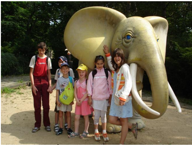
Výlet – ZOO Ústí nad Labem