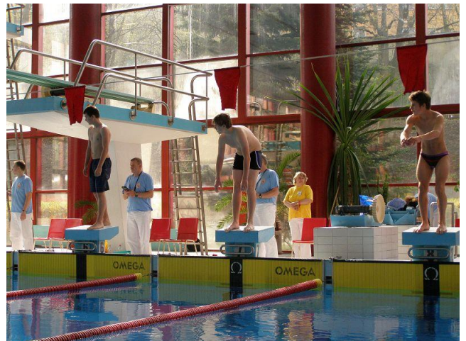
MČR v plavání - Liberec