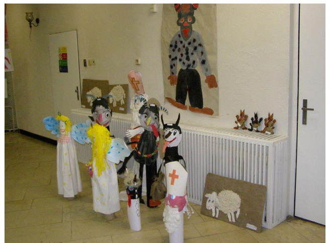
Výstava prací v kině