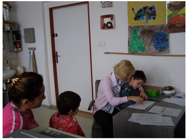
Zápis do 1. ročníku