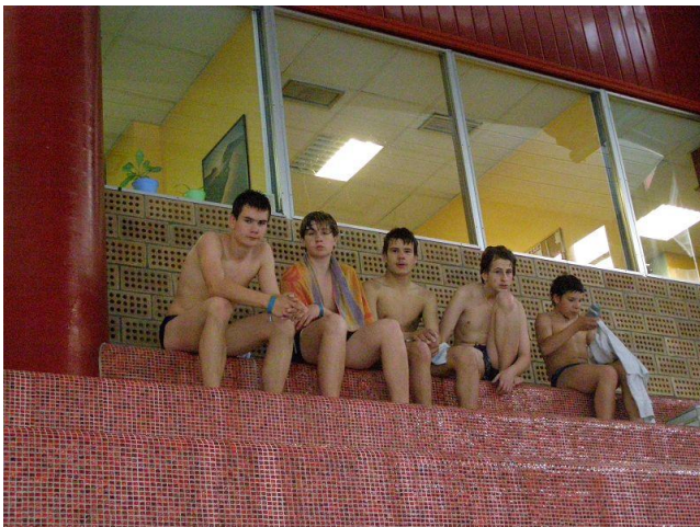
MČR v plavání – Liberec