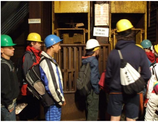
Výlet – Krkonoše