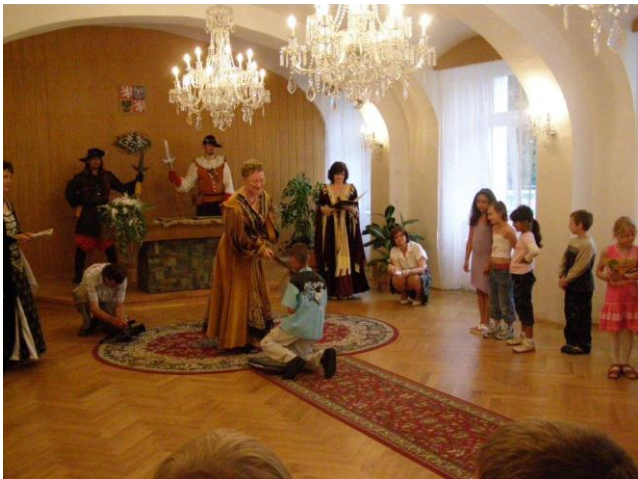
Pasování mladých čtenářů