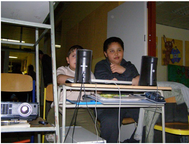
Noc ve škole I.