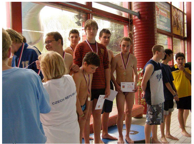
MČR v plavání - Liberec