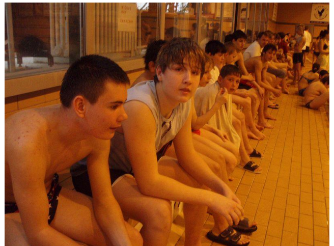
Plavecké závody - Litoměřice