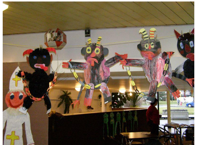
Výstava prací v kině