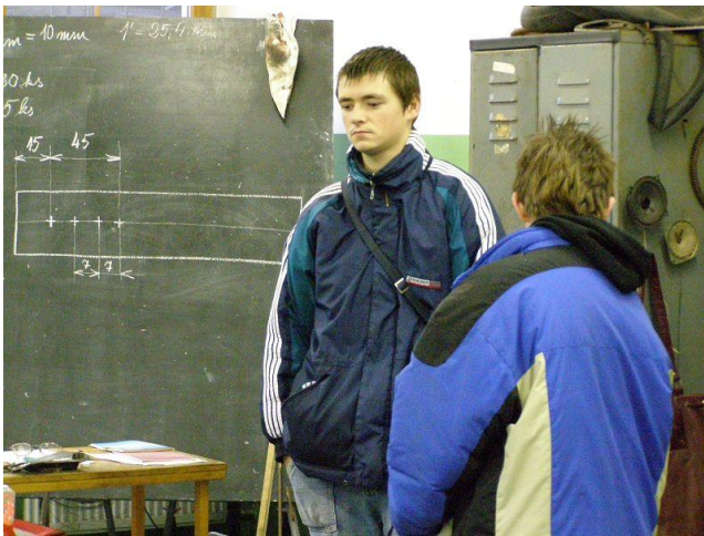
Exkurze učiliště II.