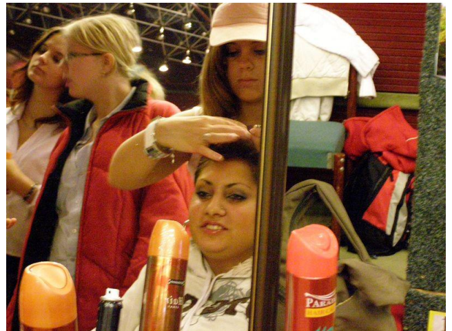
Exkurze učiliště I.