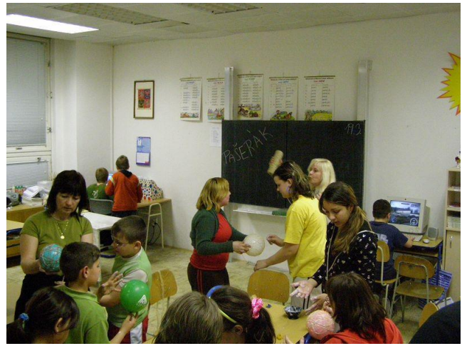
Noc ve škole I.