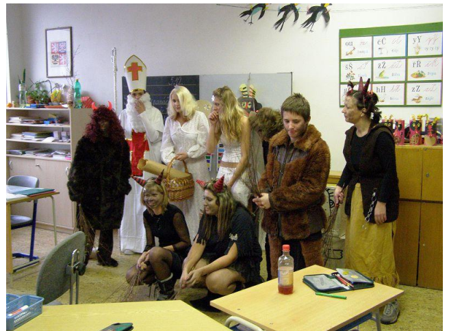
Mikulášská nadílka - příprava