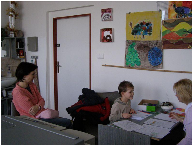
Zápis do 1. ročníku