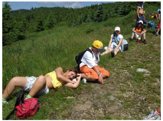
Výlet - Krkonoše