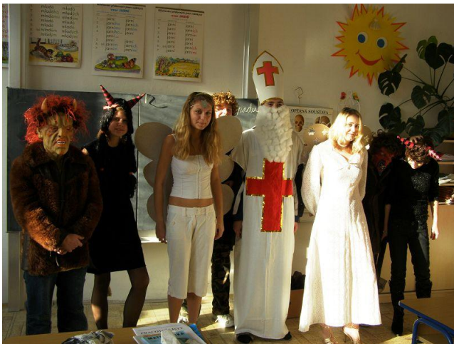
Mikulášská nadílka – příprava