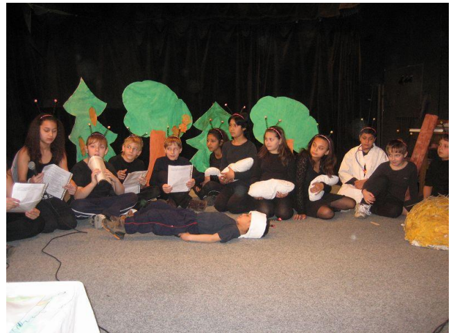
Celé Česko čte dětem