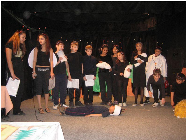
Celé Česko čte dětem