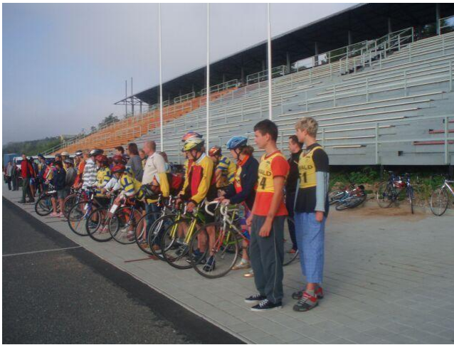
Cyklistické závody – Račice