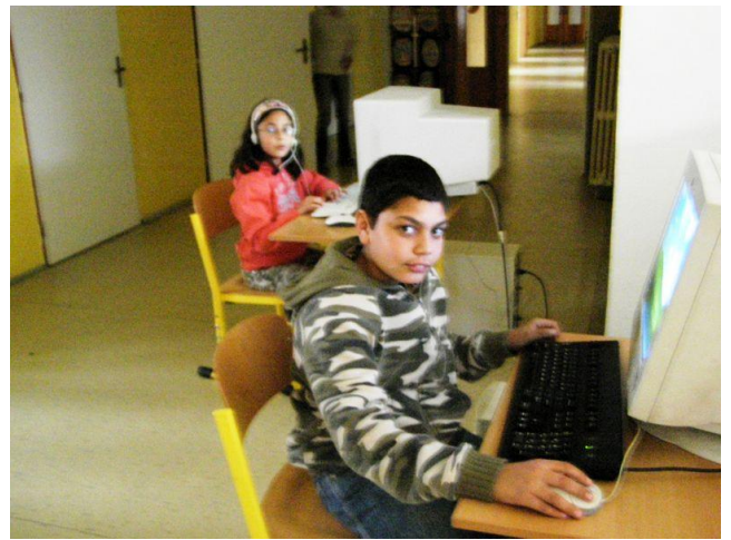
Noc ve škole II.