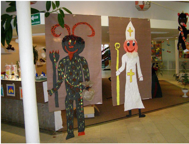
Výstava prací v kině