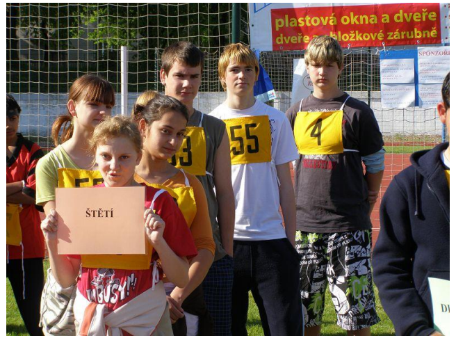
Atletika – Roudnice nad Labem