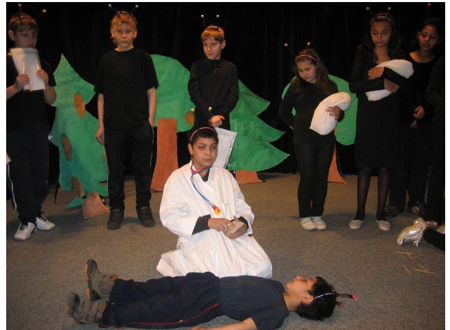
Celé Česko čte dětem