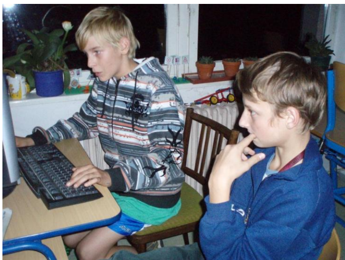
Noc ve škole