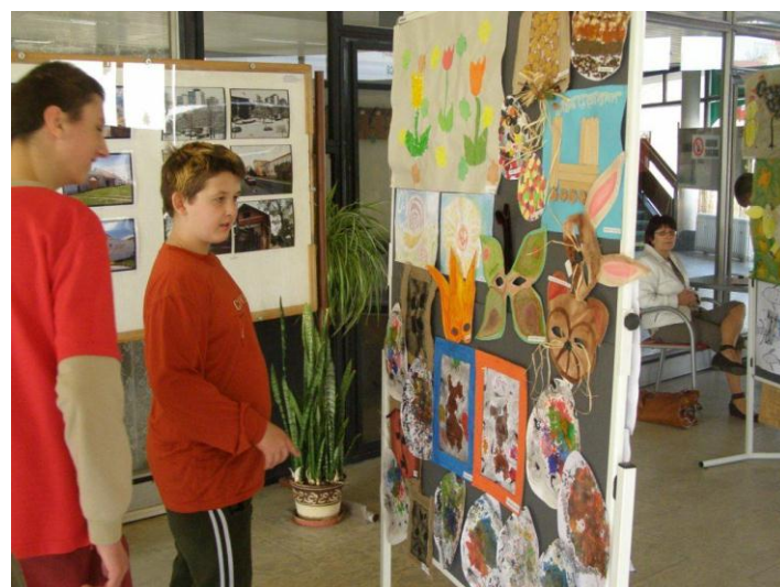
Velikonoční výstava prací – Kino Štětí