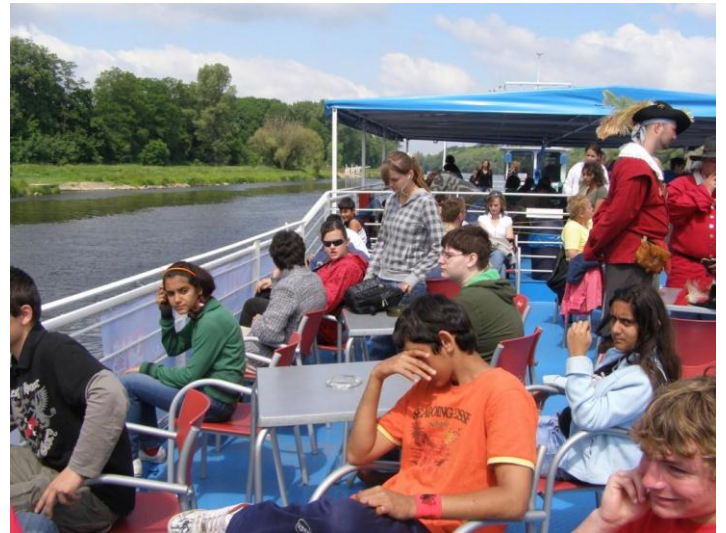
Výlet na lodi