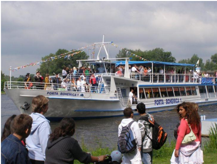
Výlet na lodi