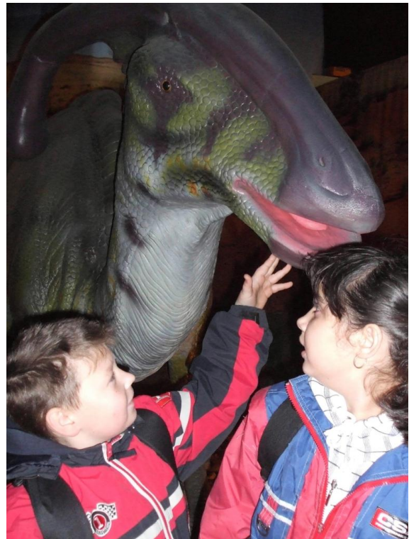
Výlet – dinosauři v Litoměřicích