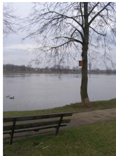
Instalované ptačí budky