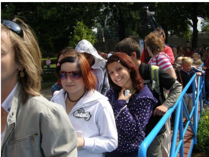
Výlet na lodi