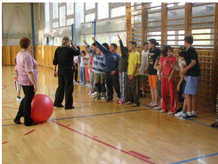
Noc ve škole