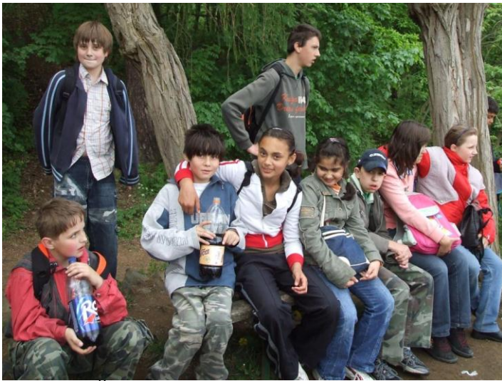
Výlet – Říp