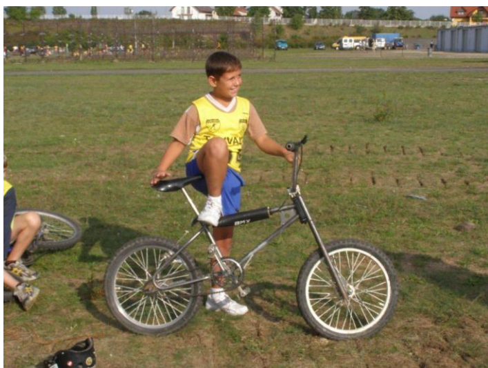
Cyklistické závody – Račice