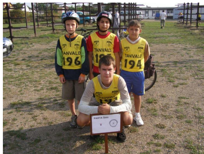
Cyklistické závody – Račice