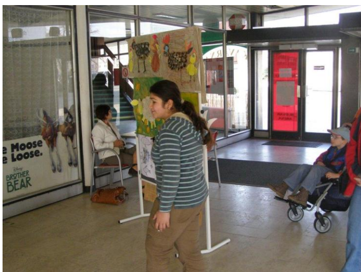
Velikonoční výstava prací – Kino Štětí