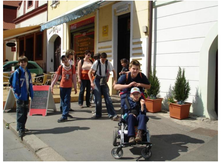
Výlet – Mělník