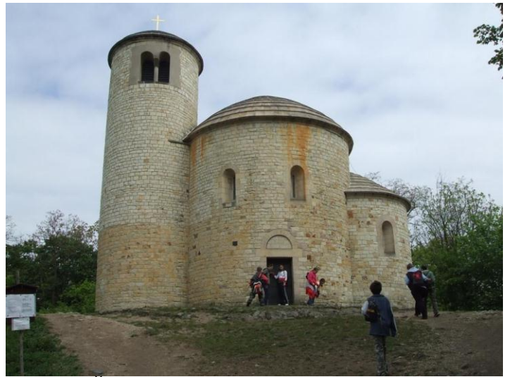
Výlet – Říp