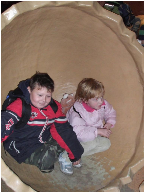
Výlet – dinosauři v Litoměřicích