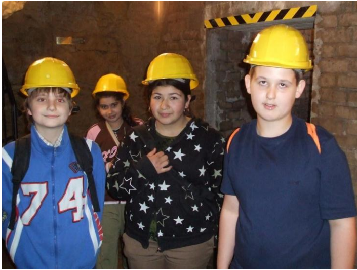
Výlet – Mělník