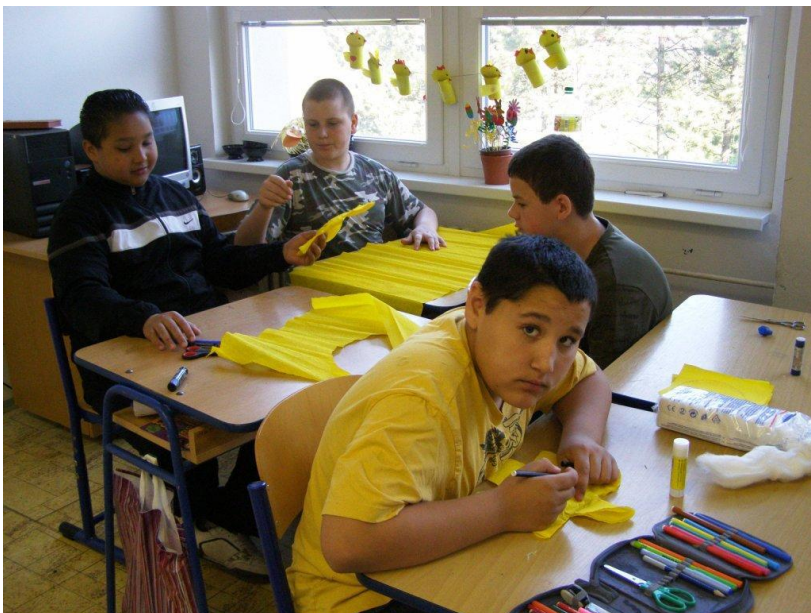
Projektový den „Barvy“