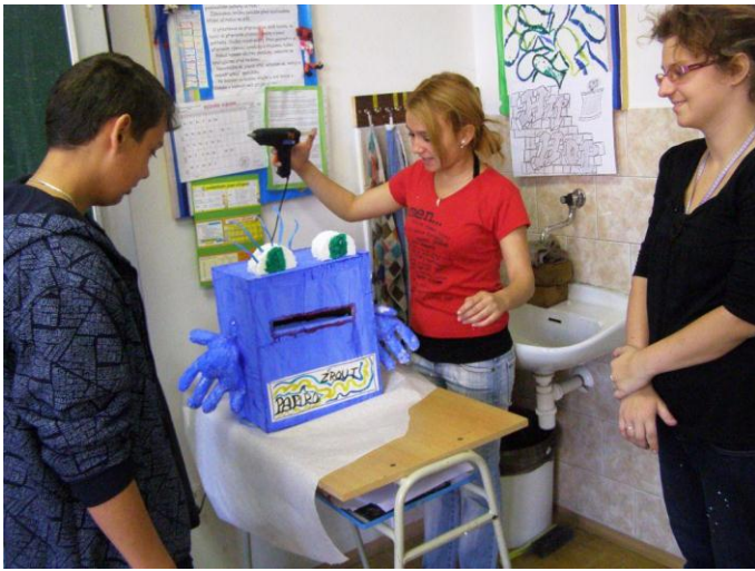
Projektový den „Den Země“