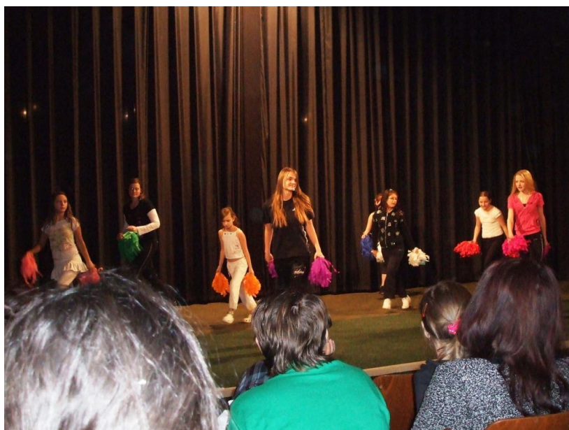
Školní akademie – jaro