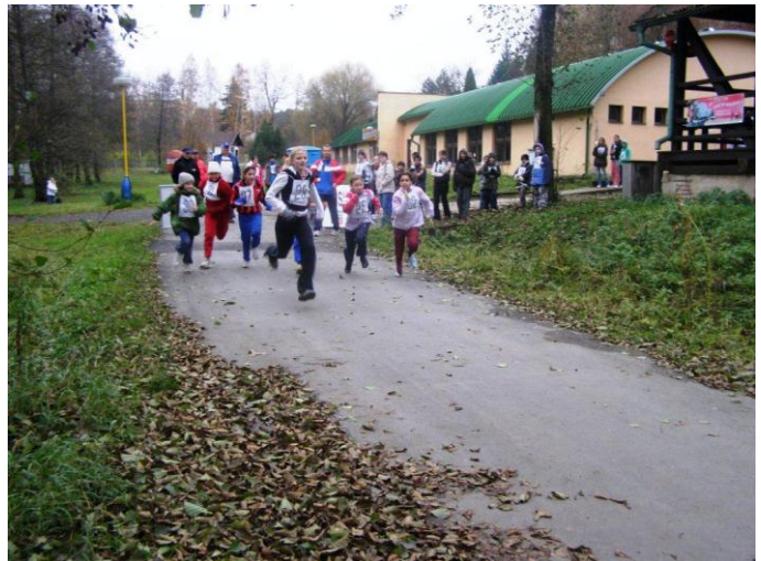
Přespolní běh - Úštěk