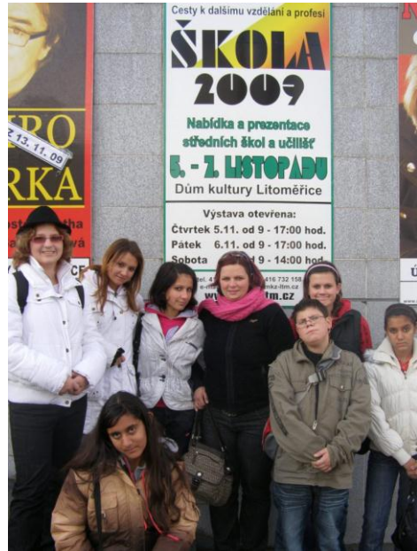
Veletrh učilišť - Litoměřice