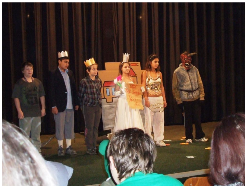
Školní akademie - zima