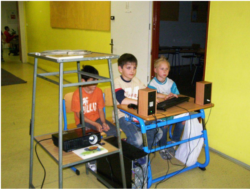
Noc ve škole I.