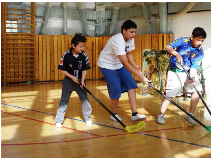
Noc ve škole II.