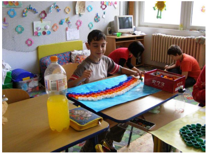
Projektový den „Den Země“