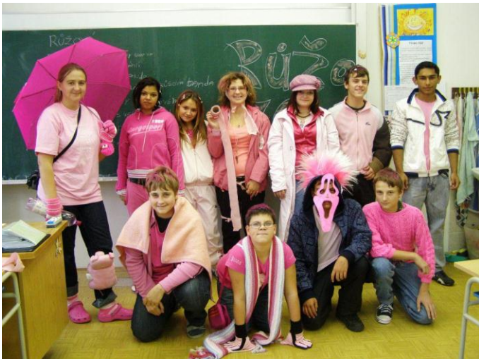
Projektový den „Barvy“