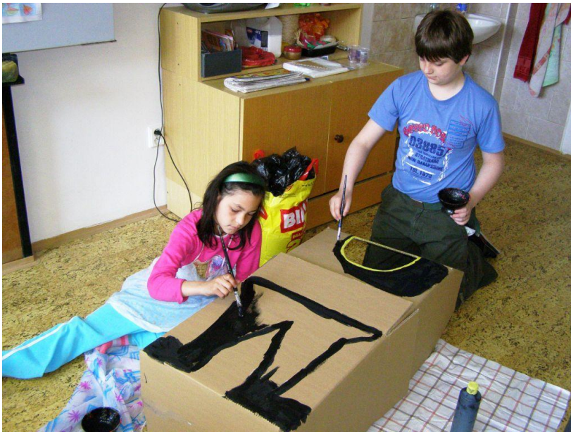
Projektový den „Den Země“