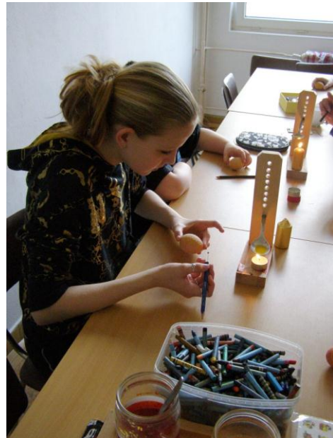
Projektový den „Velikonoční tradice“