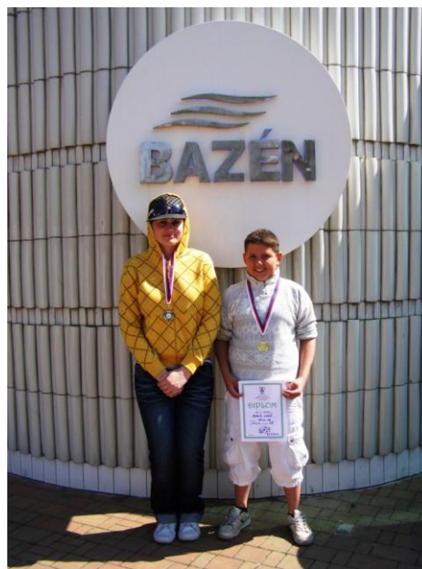
MČR v plavání - Liberec