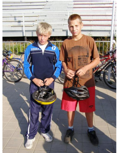
Cyklistické závody - Račice