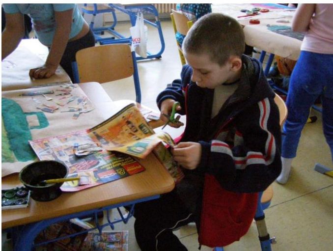
Projektový den „Den Země“