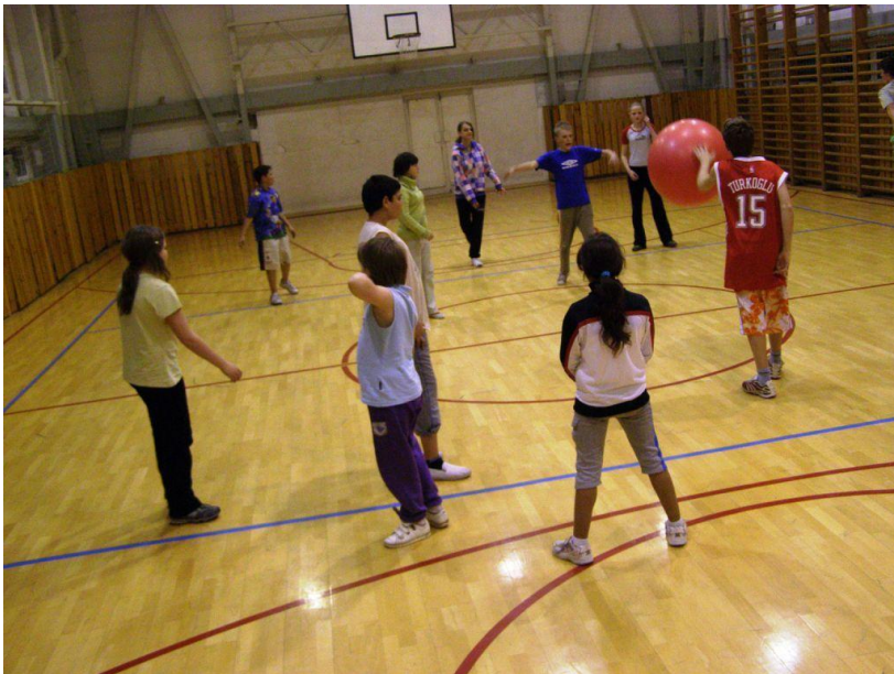
Noc ve škole II.