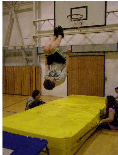
Noc ve škole III.