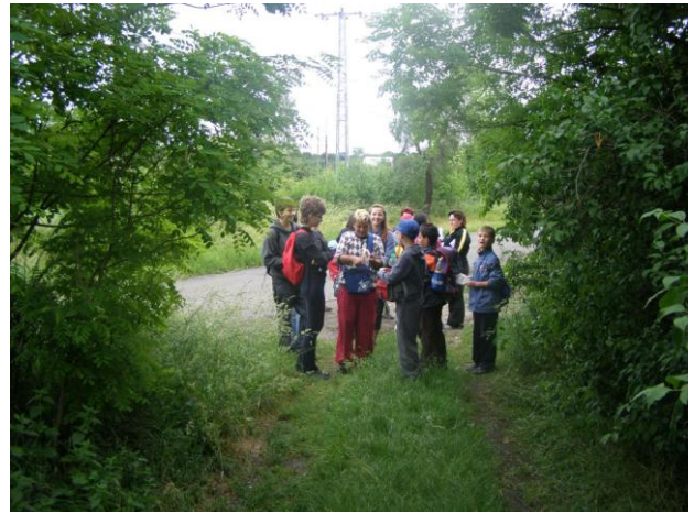
Orientační běh 2