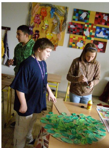
Projektový den – „Stromy ročních období“ 3