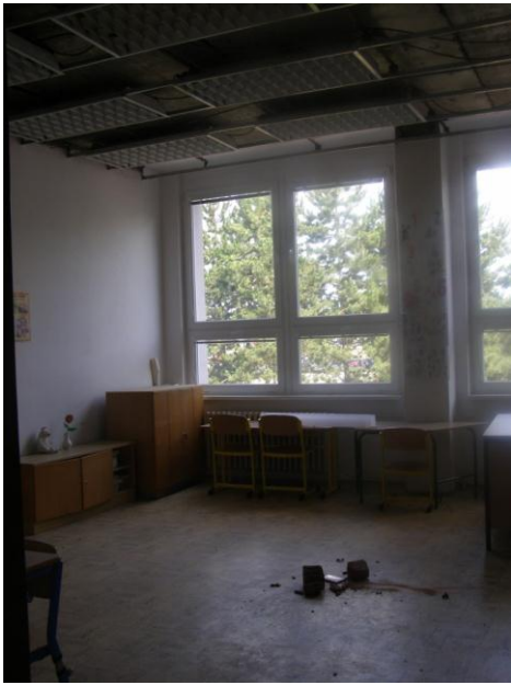
Výměna pohledů 2