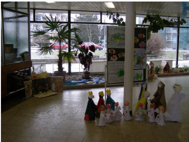
Výstava prací – Kino Štětí 2