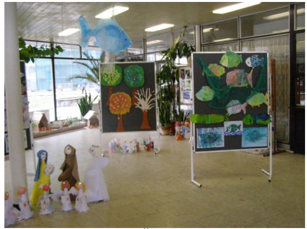
Výstava prací – Kino Štětí 1