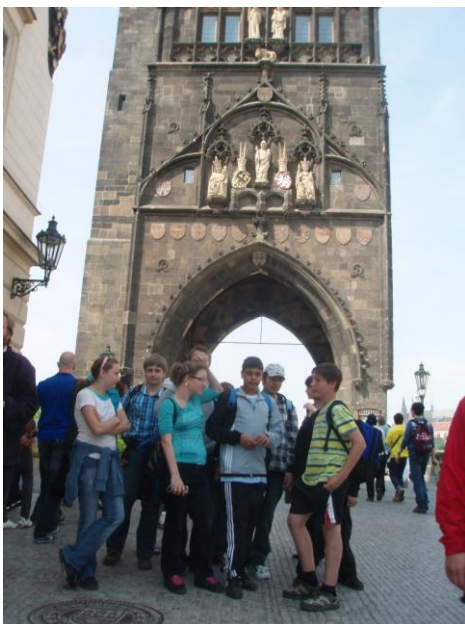
Výlet – Praha