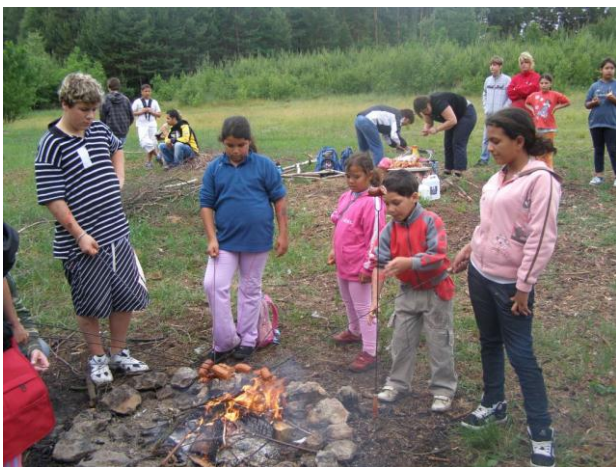
Orientační běh 3