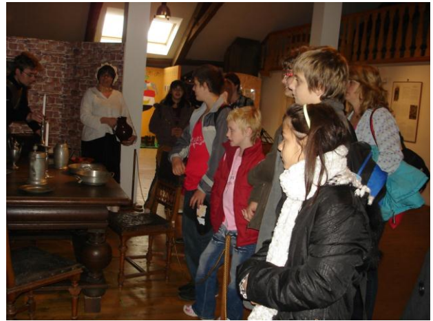
Výlet – Muzeum Mělník