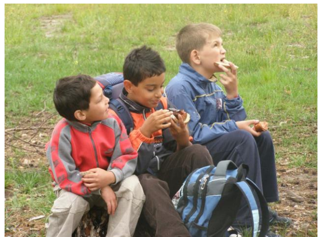
Orientační běh 4