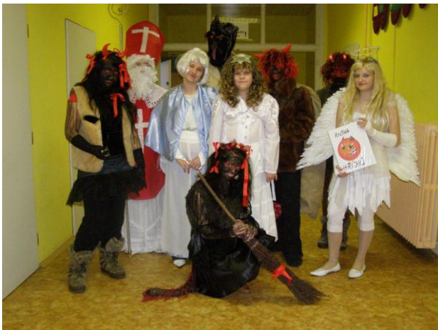
Mikulášská nadílka 2