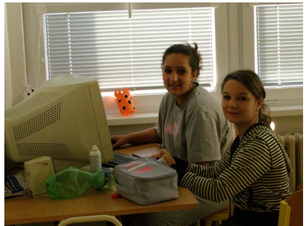
Noc ve škole 1