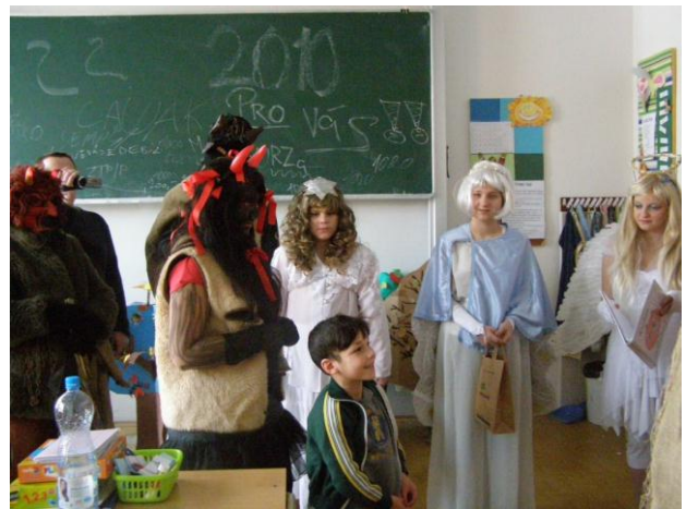
Mikulášská nadílka 1