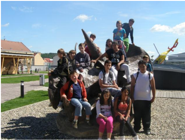
Výlet – Dinopark