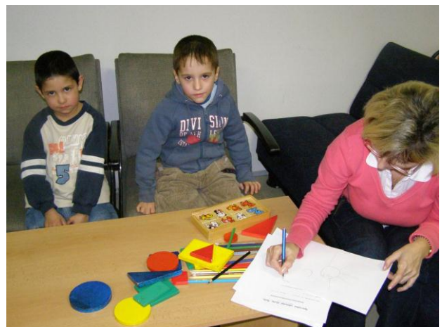
Zápis do 1. ročníku