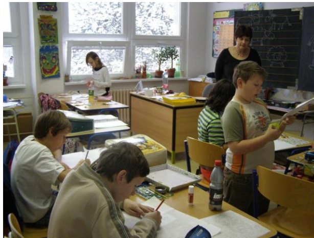
Projektový den – „Stromy ročních období“ 1