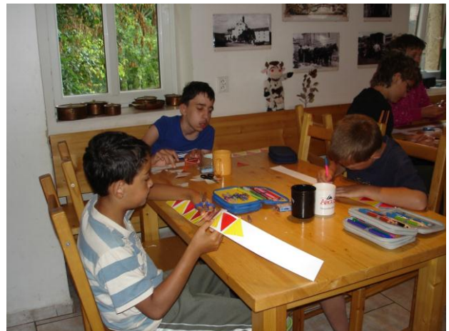
Výlet Zababeč 1