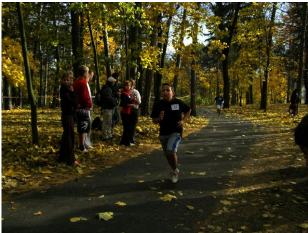
Přespolní běh – Litoměřice