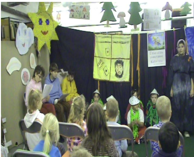
Celé Česko čte dětem 1