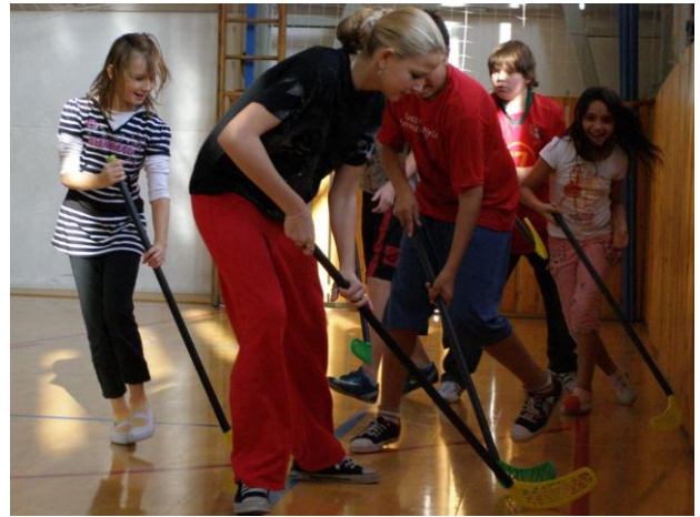
Noc ve škole 3