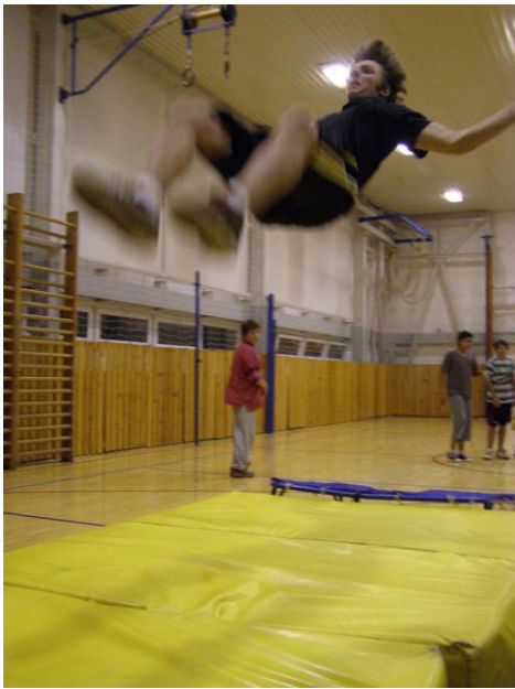
Noc ve škole 2