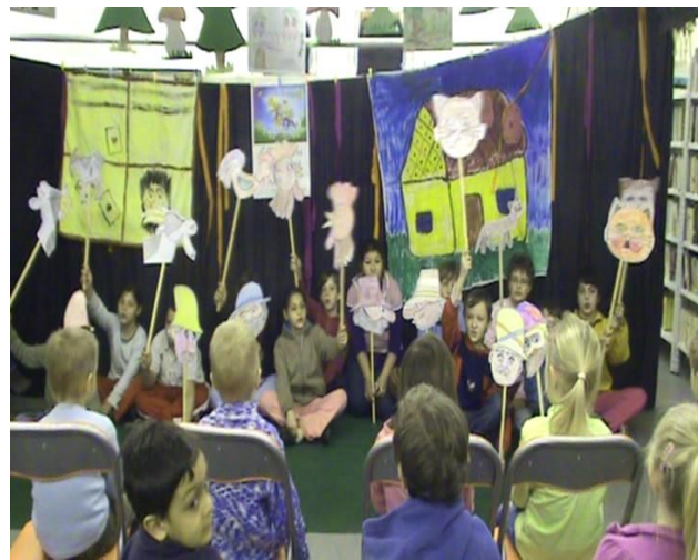
Celé Česko čte dětem 2