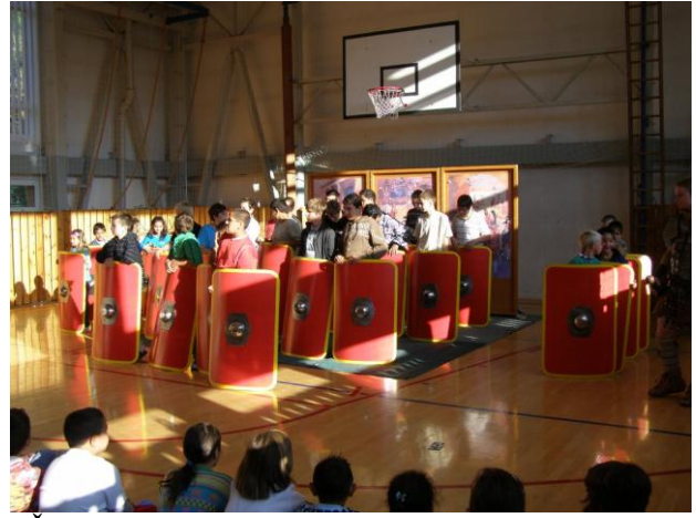
„Řím – legionáři a gladiátoři“ - představení