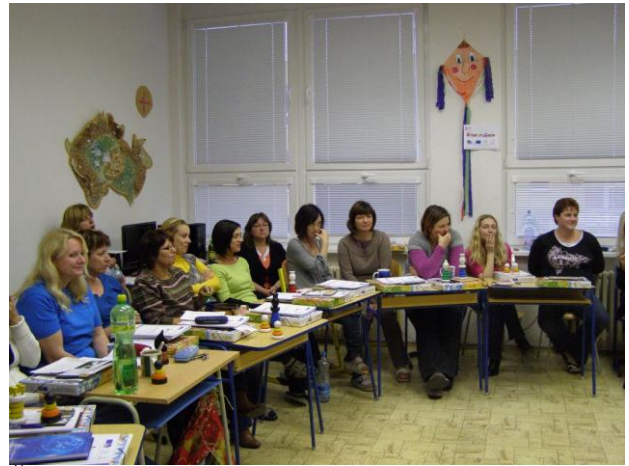
Školení – „Figurková školička“