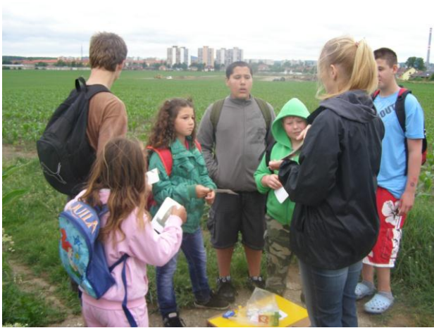
Orientační běh 1