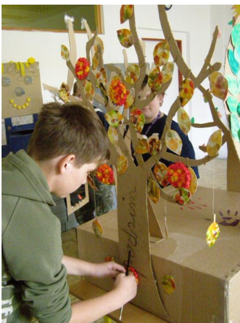
Projektový den – „Stromy ročních období“ 2