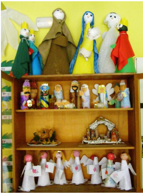
Projektový den - „Betlém“