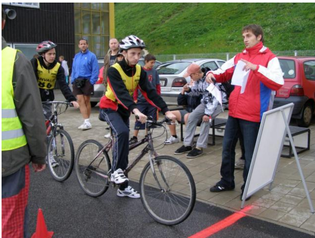
Cyklistika – Račice