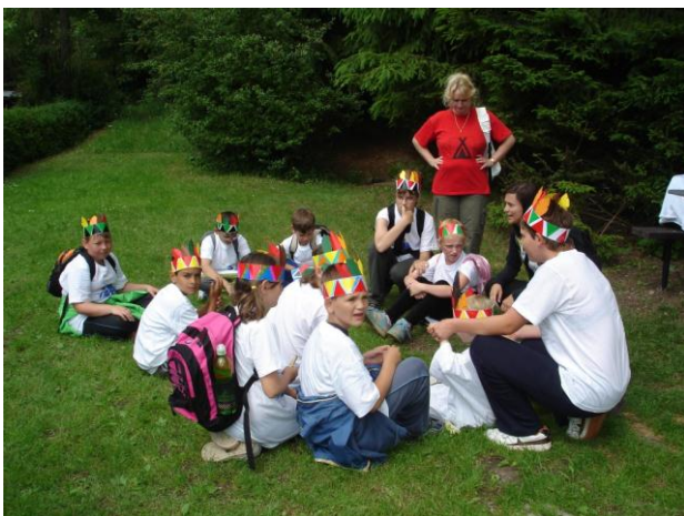
Výlet Zababeč 2