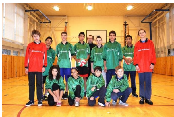
Roudnice nad Labem